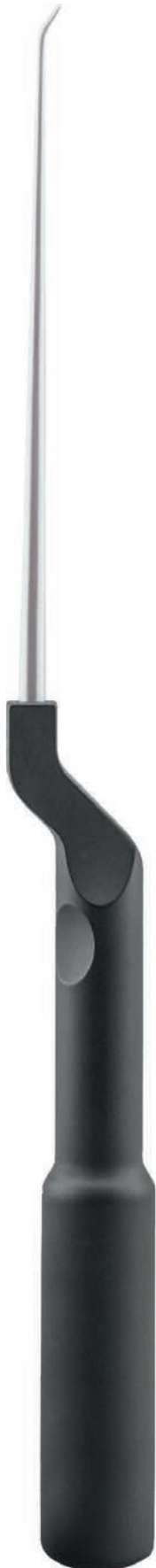
forward curved vorwärts gebogen