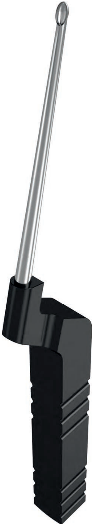
forward straight vorwärts gerade