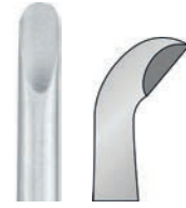
backward curved rückwärts gebogen